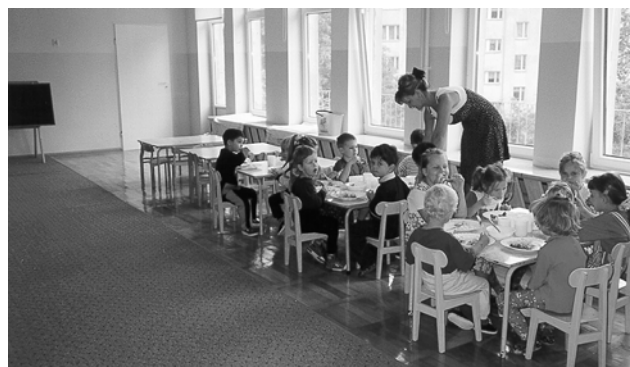
Przedszkole Miejskie nr 2