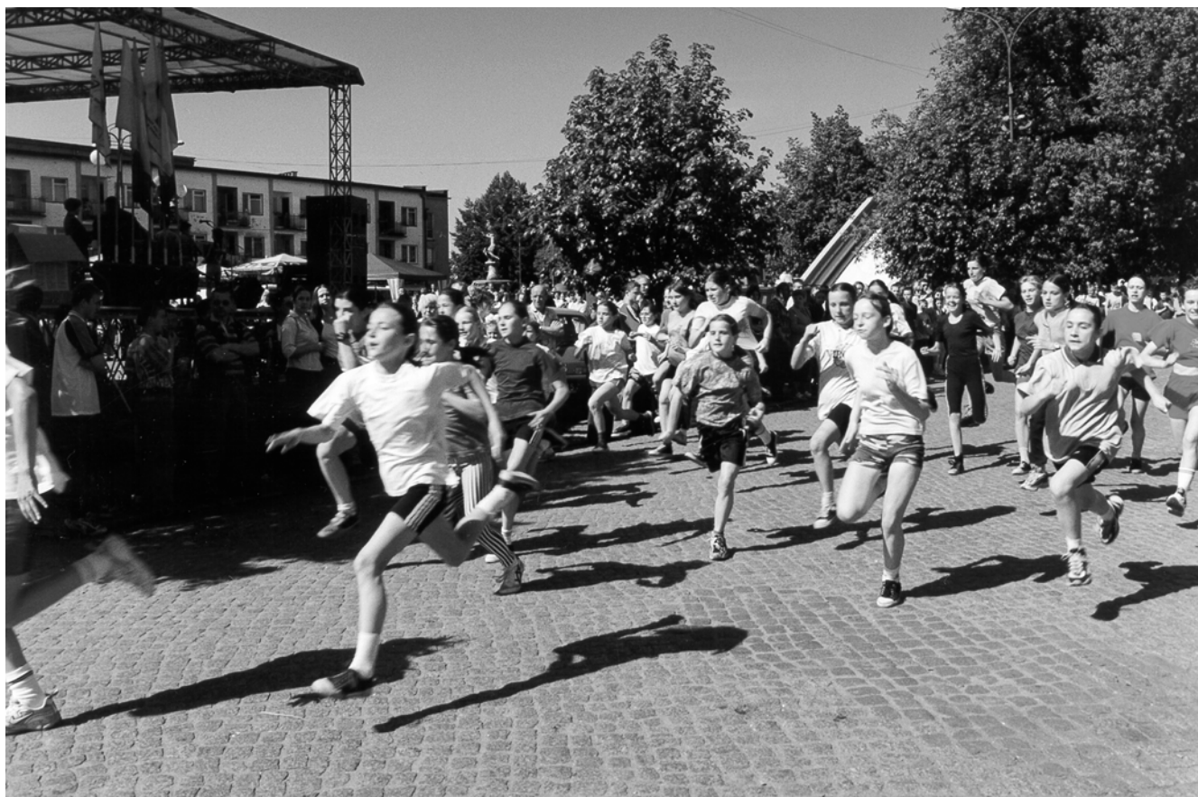
MAJOWE BIEGI ULICZNE

W ostatnim czasie – przy organizacyjnym wsparciu „ośrodka”, a finansowym UMiG – w Strąpiu, Lutówku, Starej Dziedzinie, powstały piłkarskie kluby sportowe.