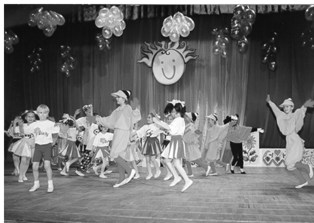
5-lecie zespołu „UŚMIECHY”