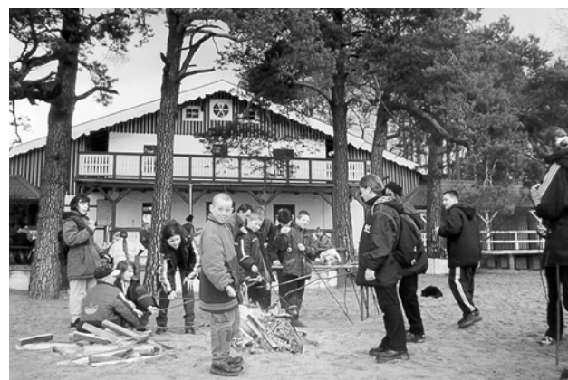
Ferie zimowe. Ognisko po rajdzie pieszym wokół jeziora.