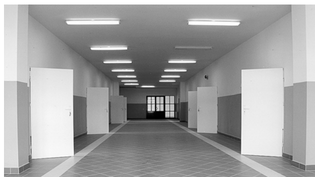
SP nr 4 im. H. Sienkiewicza w Barlinku