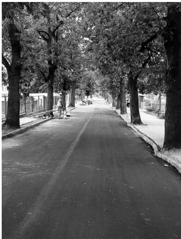
Nowy asfalt na ul. Szpitalnej

Na terenie miasta wykonano remont ulic o nawierzchni gruntowej i żuźlowej na ulicach: Flukowskiego, Łokietka, Długa, Młyn Leśny, Polana Lecha, Wypiańskiego, części ul. Fabrycznej.