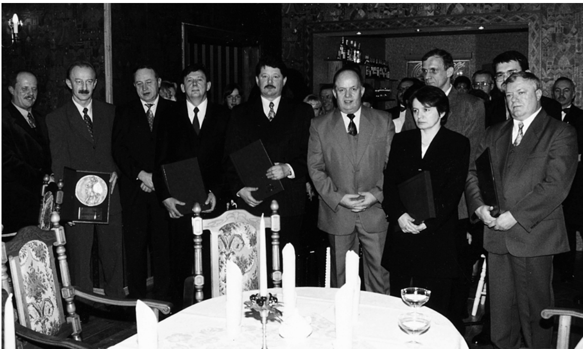
Złote Gęsiarki '98

W kwietniu 1999 r. rozpoczęło działalność Barlineckie Towarzystwo Budownictwa Społecznego. Z jego powstaniem wiąże się nadzieje na częściowe złagodzenie problemu mieszkaniowego. W roku 2000 BTBS przystąpił do pierwszych dociepleń budynku mieszkalnego. Przed nami następne dwa lata kadencji obecnej Rady Miejskiej. Kierunki rozwoju i zadania wynikać będą przede wszystkim ze: