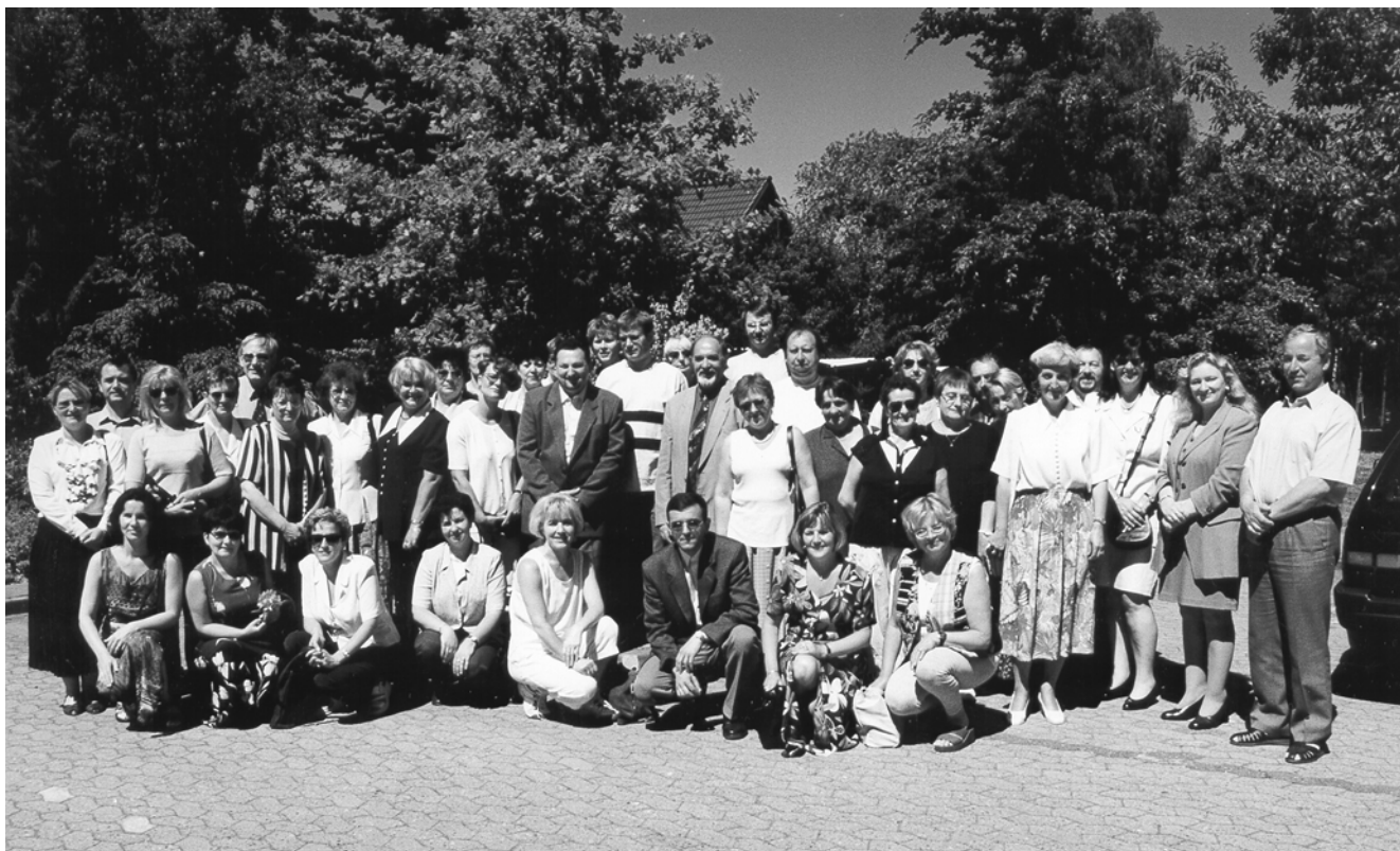
Delegacja Barlinka z wizytą w Schneverdingen