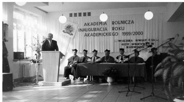
Inauguracja roku akademickiego 1999/20000 w Terenowym Obiekcie Dydaktycznym Akademii Rolniczej w Szczecinie