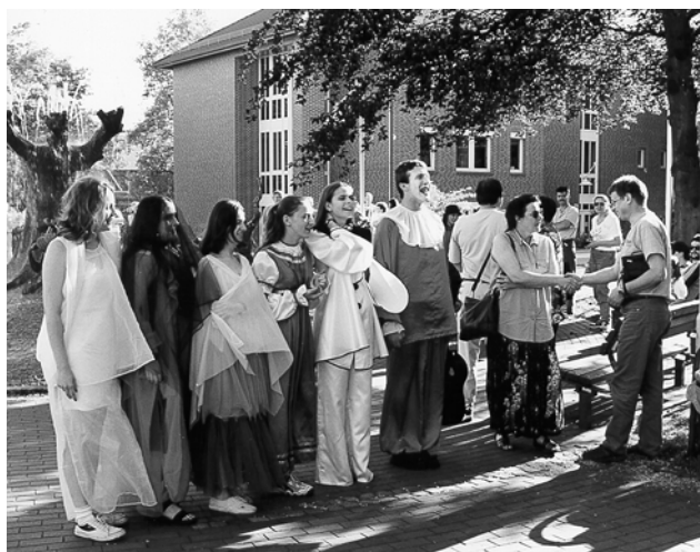
Teatr „WIATRAK” z wizytą w Schneverdingen

Realizacja wspólnej dla całego ośrodka kultury strategii rozwoju gwarantuje osiągnięcie kolejnych celów przy oszczędnym i efektywnym gospodarowaniu środkami finansowymi przeznaczonymi przez Radę Miejską na działalność Barlineckiego Ośrodka Kultury. Działalność kulturalna ma charakter koninkturowczy i jest jednym z elementów harmonijnego rozwoju naszej małej ojczyzny. Dlatego warto w nią inwestować.