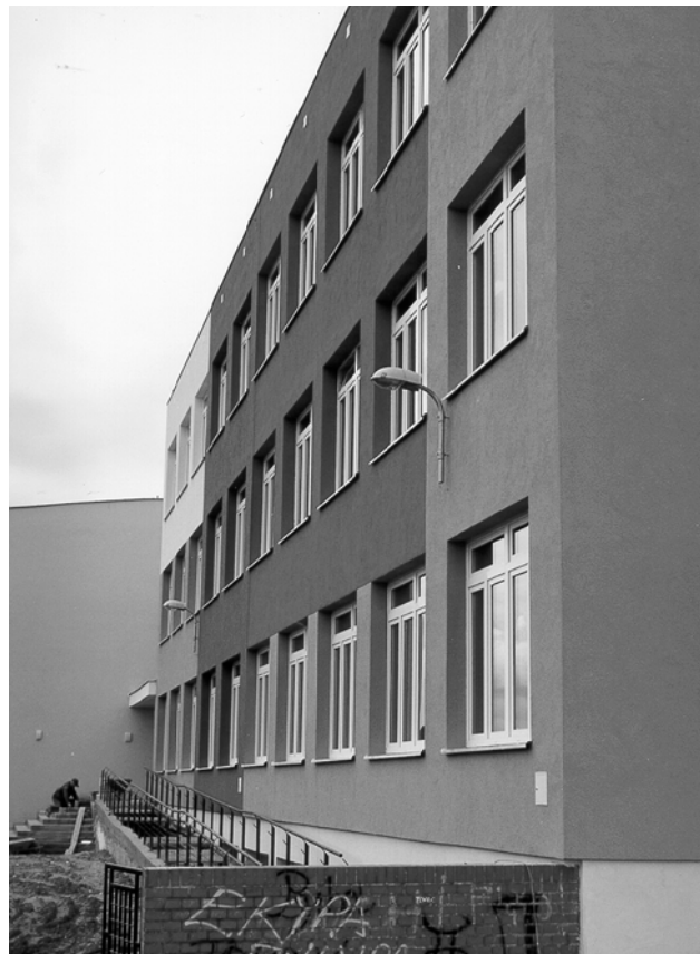
SP nr 4 im. H. Sienkiewicza w Barlinku

Powyższe wnioski zostały przyjęte na XX sesji Rady Miejskiej w Barlinku. Szczegółowy harmonogram sposobu realizacji w/w wniosków zostanie opracowany i przedstawiony do akceptacji Zarządowi i Radnym Miasta i Gminy Barlinek celem podjęcia działań w nowym roku szkolnym 2000/2001 i następnych.