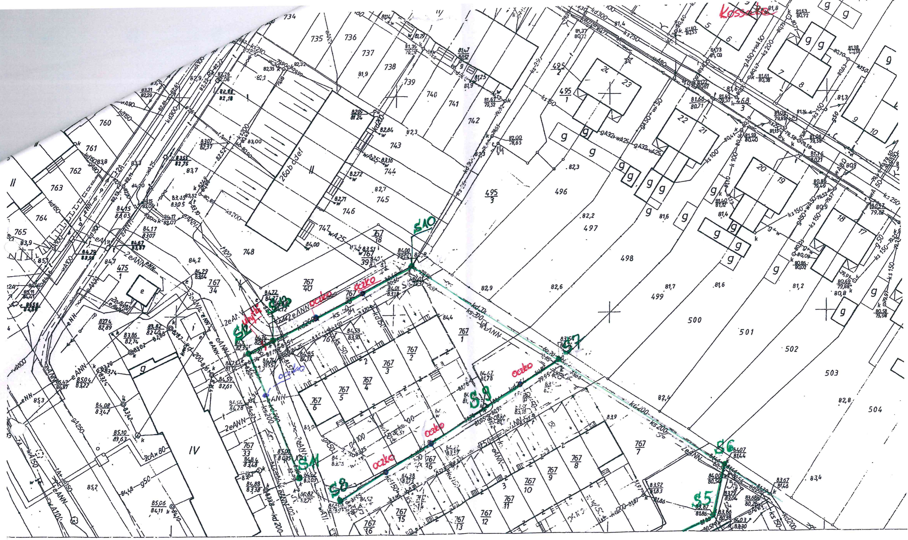
Mapa zasadnicza 1:500

o układ współrzędnych państwowy 1965, poligonizacja techniczna II klasy. OPKG Zakład Terenowy w Gorzowie Wlkp. 1977 r. Układ odniesienia: Kronsztadt. siatka kwadratów i osnowa na koordynatografie. Sytuacja i rzeźba terenu opracowano autogrametrycznie przez PPGK Warszawa w 1977 r.