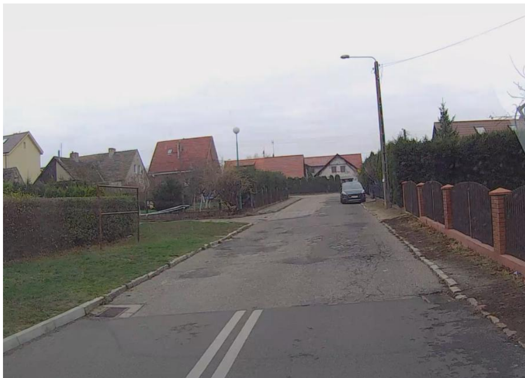
Zdjęcie nr 1 – Początek opracowania