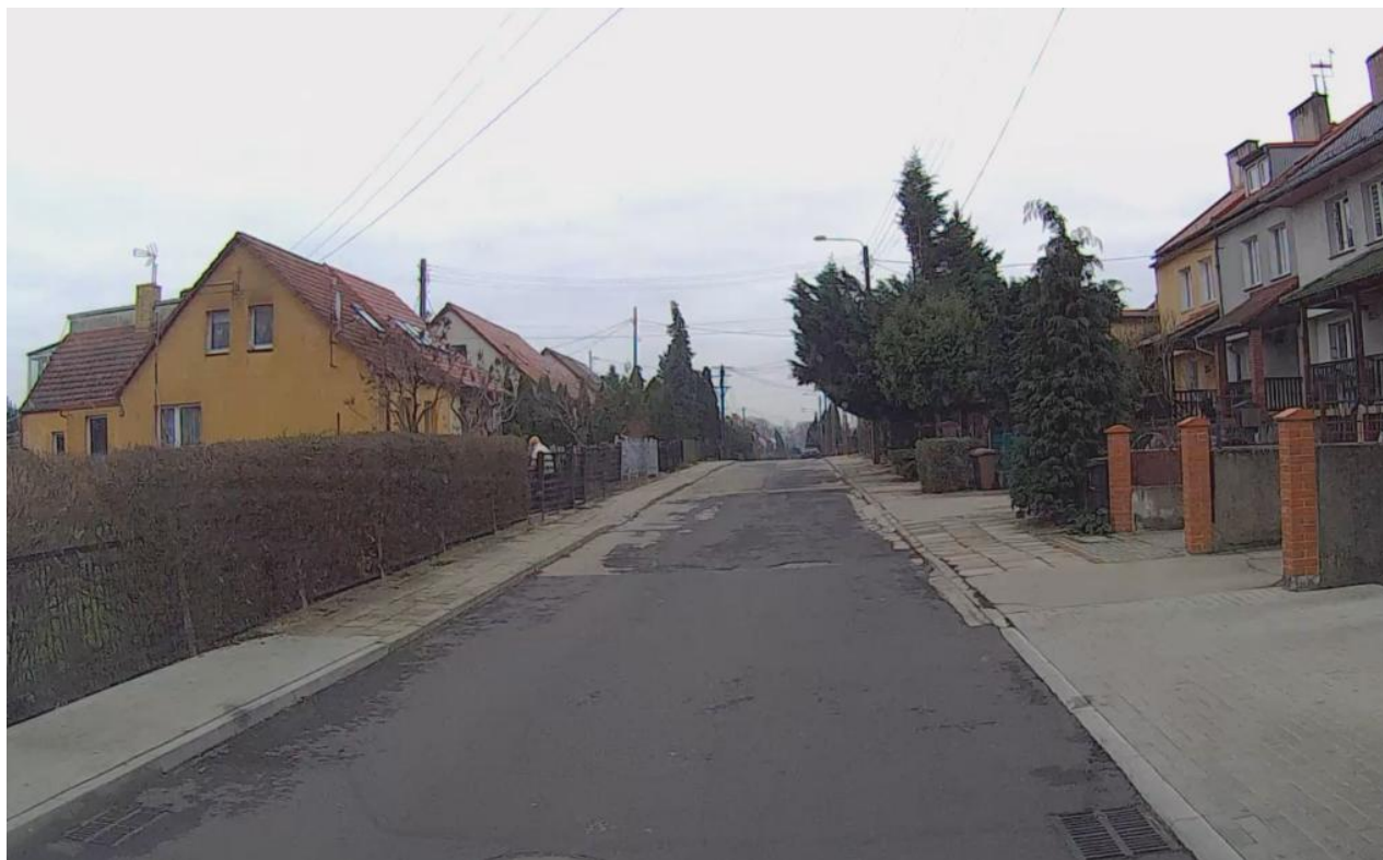
Zdjęcie nr 1 – Początek opracowania