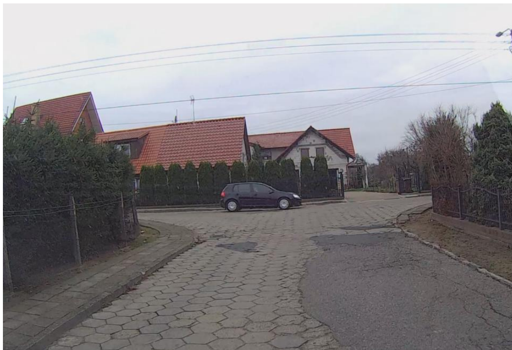
Zdjęcie nr 3 – Koniec opracowania