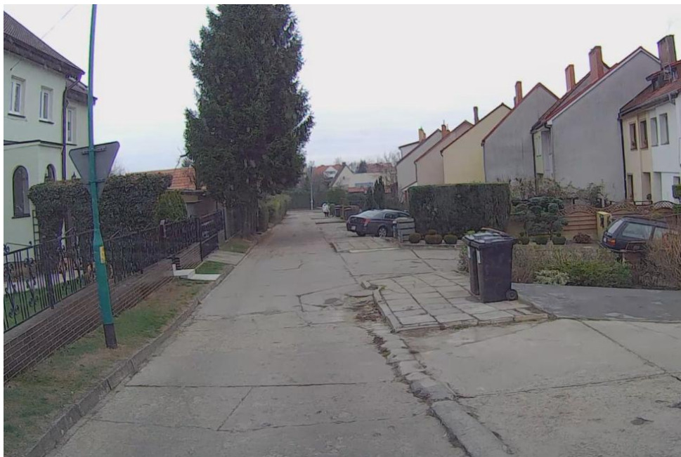
Zdjęcie nr 1 – Początek opracowania