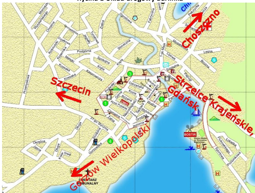
Rycina 1 Układ drogowy Barlinka